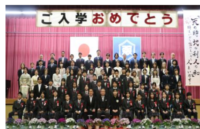
B組 新入生と保護者の皆さん