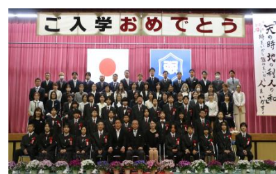
D組 新入生と保護者の皆さん