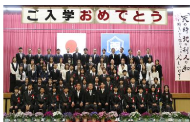
C組 新入生と保護者の皆さん