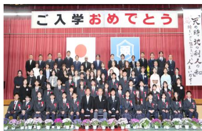
A組 新入生と保護者の皆さん