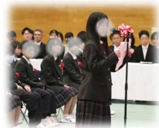
(新入生誓いの言葉)